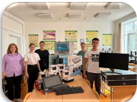
Школьный Универсальный Медиацентр «ШУМ», село Окуновка, Республика Крым