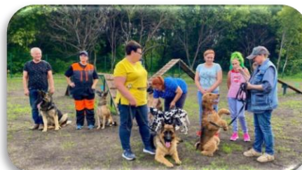
Фитнес-зал на открытом воздухе для четвероногих, г. Березовский, Кемеровская область - Кузбасс