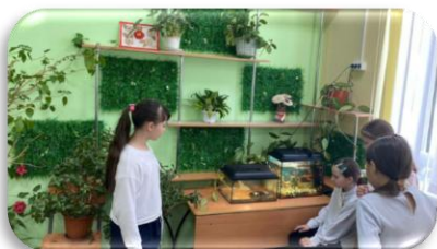
Живая планета школы, г. Медногорск, Оренбургская область