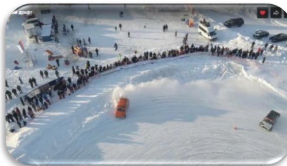
Трасса для дрифта в Губкинском молодежном спортивном техническом клубе «Полярная механика», Ямало-Ненецкий автономный округ