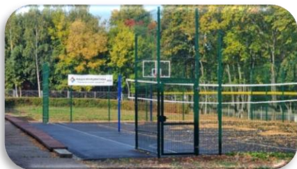
ЛИГА 12 - возрождение школьного стадиона, г. Сарапул, Удмуртская Республика